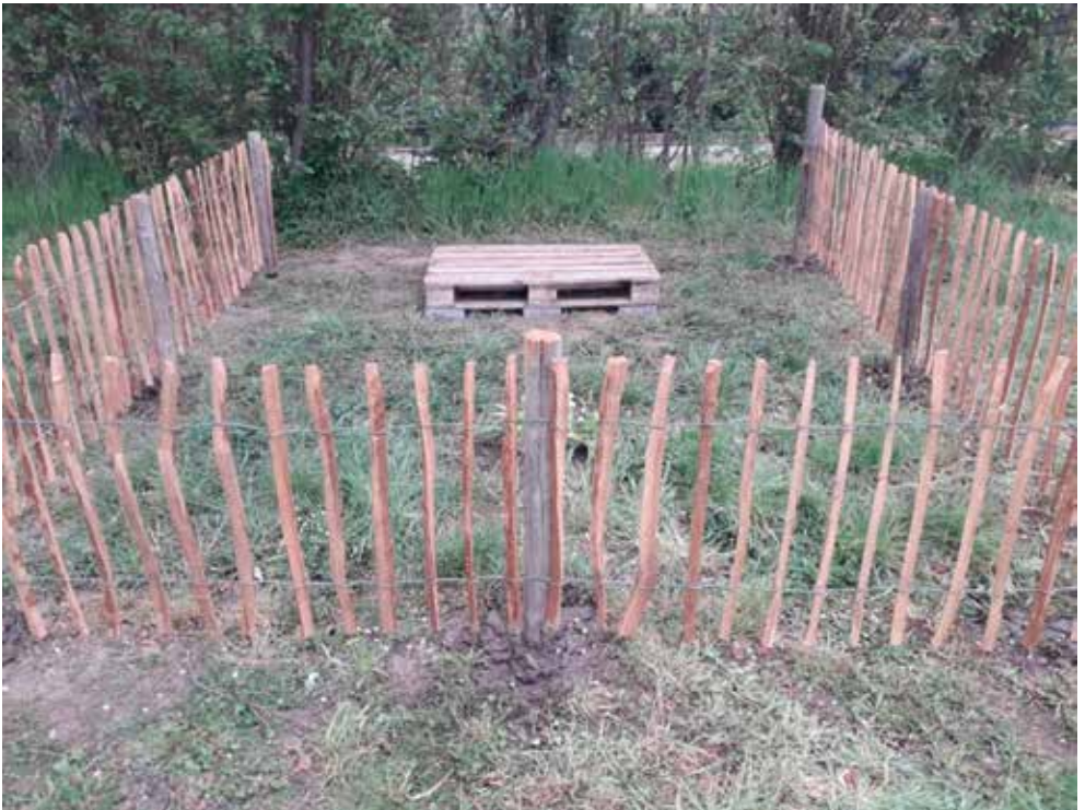
Vorbereitete Aufstellfläche mit Schutzzaun

Ein Bienenvolk kann aus ca. 50.000 Bienen bestehen.