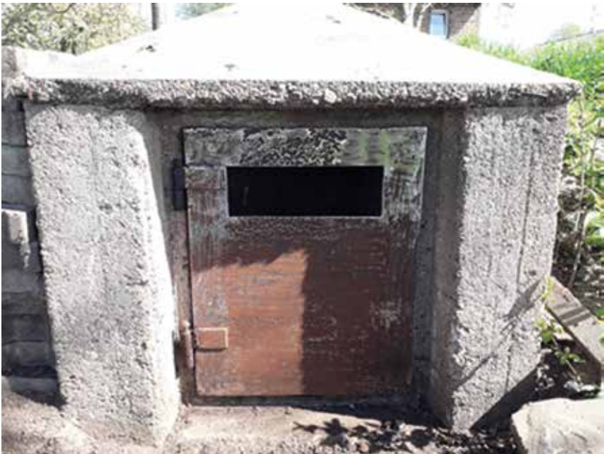
Erstellte Einflugöffnung in der Notausstiegsklappe