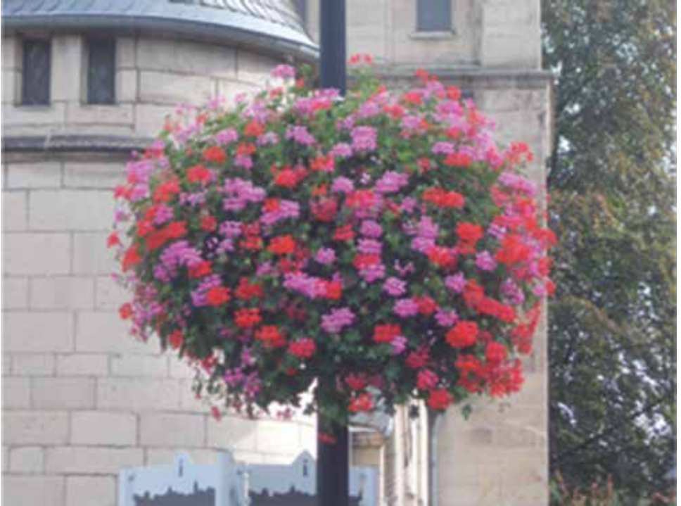
„Blumenampeln“ Sommer 2019

möchten wir auch 2020 unseren historischen Ortskern erneut aufblühen lassen!