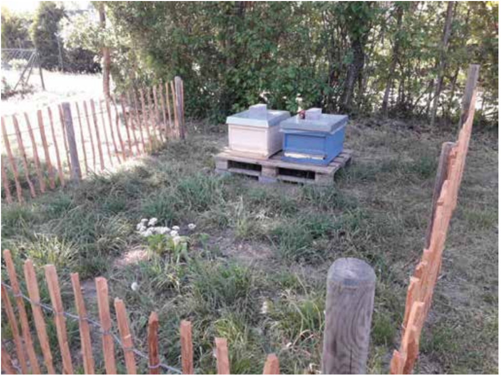
Zwei Bienenvölker sind am 25.04.2020 eingezogen