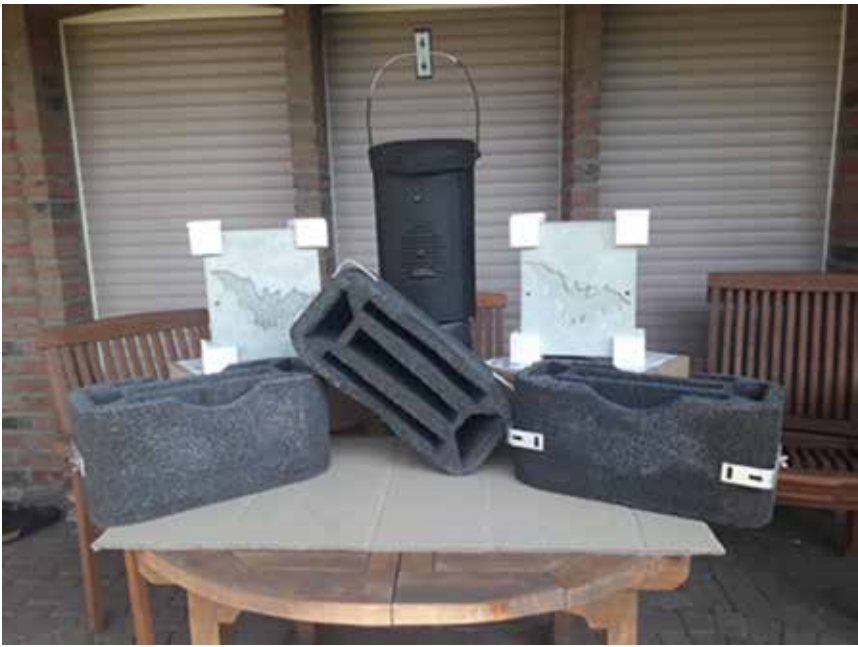
Fledermaus-Gewölbesteine, -Wandschalen und -Kasten